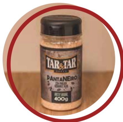
Pantaneiro com Pimenta Bodinha e Alho