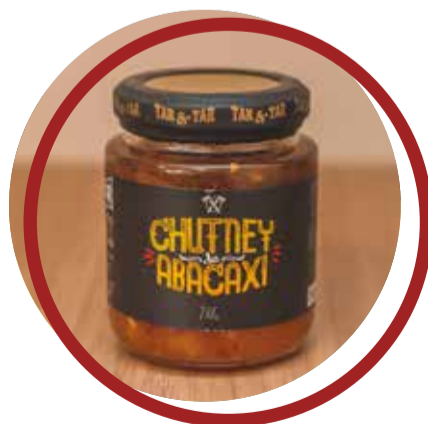
Chutney de Abacaxi