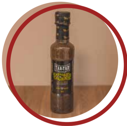
Expresso do Oriente