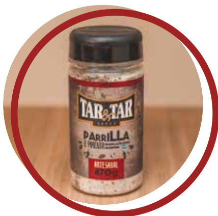
Parrilla e Pimenta