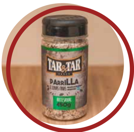
Parrilla e Ervas Finas