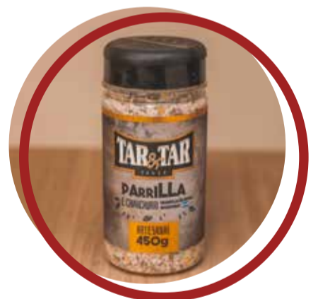
Parrilla e Chimichurri