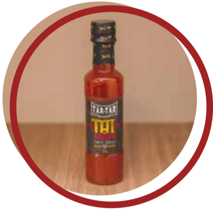
Tai de Pimenta