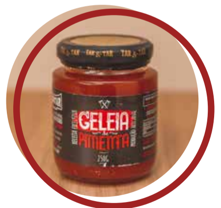
Geleia de Pimenta