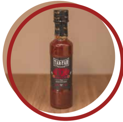
Ketchup Goiabada Defumado