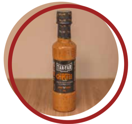
Creme de Pimenta Chipotle