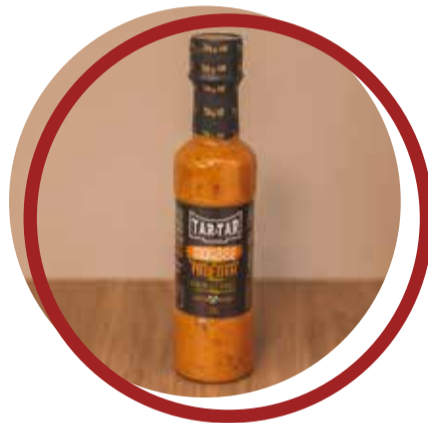
Mousse de Pimenta & Ervas